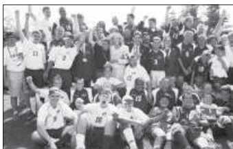
Durchführung der ersten Sommerspiele in Chicago mit über 1.000 Athleten