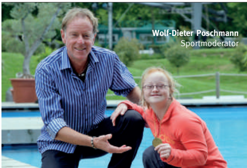
Wolf-Dieter Poschmann Sportmoderator