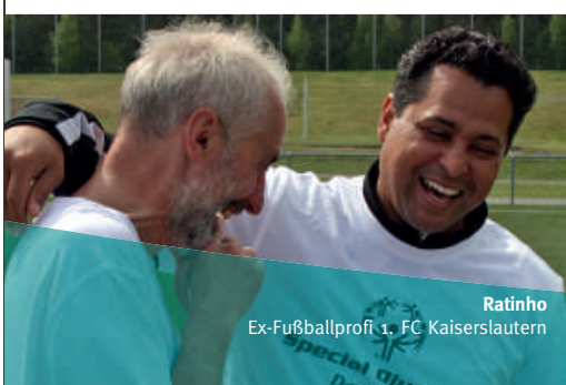
Ratinho Ex-Fußballprofi 1. FC Kaiserslautern