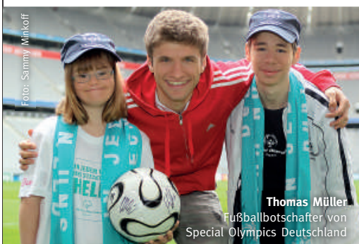
Thomas Müller Fußballbotschafter von Special Olympics Deutschland