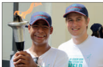
3. Landesspiele in Bitburg (über 2.500 Teilnehmer, 15 Sportarten)