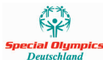
Gründung von Special Olympics Deutschland e.V.