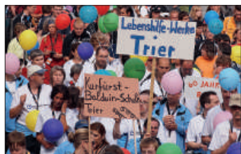
Erste Landesspiele von Special Olympics Rheinland-Pfalz in Bad Kreuznach (über 900 Teilnehmer, 7 Sportarten)