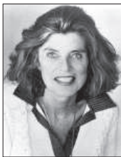
Gründung von Special Olympics durch Eunice Kennedy-Shriver