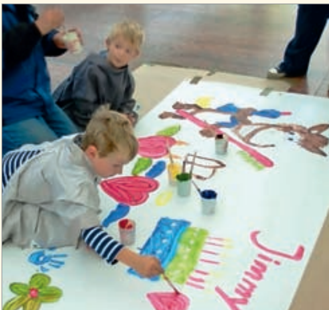
Mit viel Freude malten die Kinder dem Zahnputzpfred Jimmy Geburtstagsbilder.