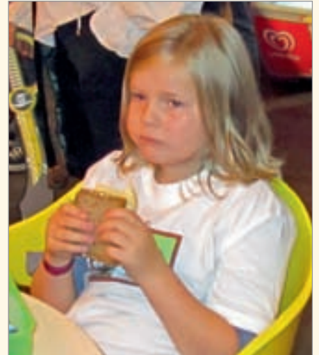
Nach den ersten Aktionen des Tages bekam jedes Kind eine gut gefüllte Frühstücksdose nebst einem warmen Kakao.

land als Erinnerung und der Rücktransfer zu den Schulen konnte erfolgen. Manch einer, so der Bericht einer Lehrerin am Folgetag, war schon kurz nach dem Losfahren vor lauter Erschöpfung eingeschlafen.