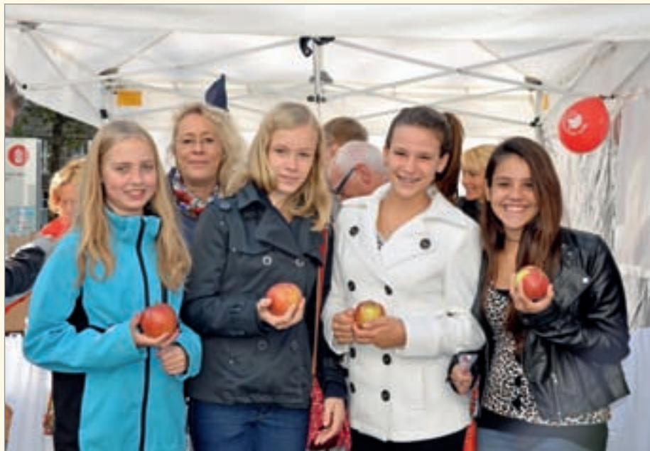
Begeistert von der Düsseldorfer Aktion war auch eine Gruppe von Austauschschülerinnen der Deutschen Schule in Rio de Janeiro, die an diesem Tag mit ihren deutschen Gastfamilien eine Besichtigungstour durch Düsseldorf machten. Sie freuten sich ganz besonders über die lustigen Zahntiger-T-Shirts mit deutschem Text, den sie nach eigener Angabe sogar verstehen konnten.

Große Begeisterung löste die Veranstaltung auch bei einer Gruppe von Austauschschülerinnen der Deutschen Schule in Rio de Janeiro aus, die an diesem Tag mit ihren deutschen Gastfamilien eine Besichtigungstour durch Düsseldorf machten. Es ist bemerkenswert, wie viele Menschen in die Landeshauptstadt Düsseldorf reisen und wie international das Publikum am Stand war. So können die Veranstalter sich rühmen, mit der Aktion