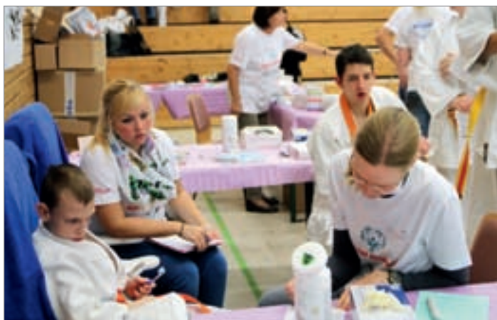
Viele Athletinnen und Athleten zeigen großes Interesse an ihrer Mundgesundheit.