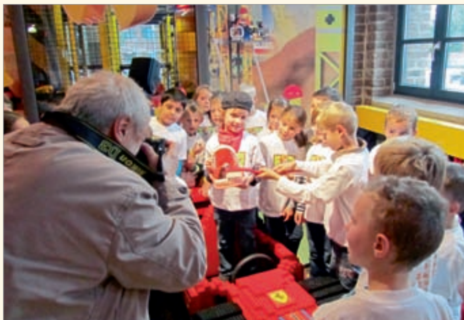
Auch die Presse „schoss“ für ihre Berichterstattung ein paar Fotos im Legoland.