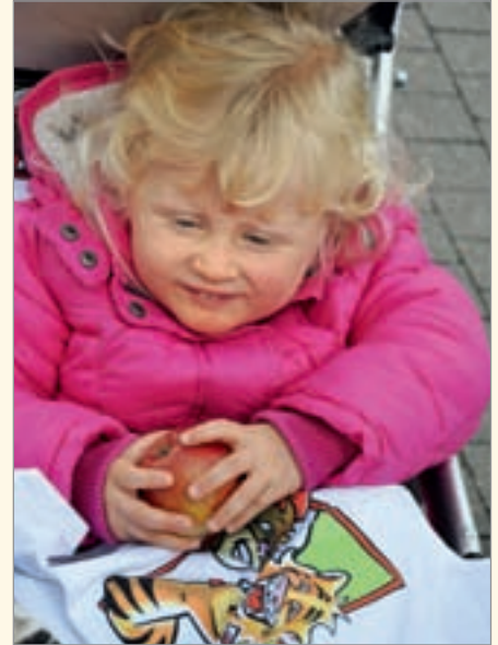
Auch dem ganz jungen Publikum wurde einiges geboten, zum Beispiel leckere Äpfel und Dr. Zahntiger-T-Shirts.

ckigen Äpfeln aus dem „Apfelparadies“ und von den Aktivitäten des Clowns Tiftof – deutliches Interesse am Standangebot zeigten. Zeitweise war der Andrang so groß, dass sich sogar Warteschlangen bildeten. Viele Standbesucher nutzten die Gelegenheit, die anwesenden Zahnärztinnen und Zahnärzte zu Themen