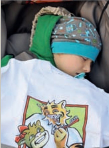
Unter dem wachsamen Blick von Dr. Zahntiger ließ es sich wohl behütet schlummern. Die T-Shirts stellte der ÖA-Ausschuss der KZV Nordrhein zur Verfügung.