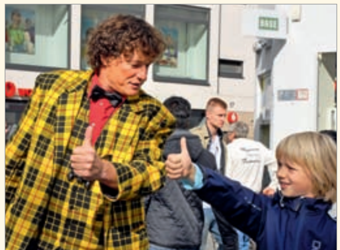
Die Daumen hoch hieß es nicht nur bei Clown Tiftof und seinen jungen Fans angesichts der gelungenen Düsseldorfer Aktion zum diesjährigen Tag der Zahngesundheit.