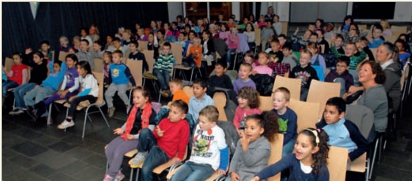
Die Arbeitsgemeinschaft Zahngesundheit im Kreis Mettmann führte das Theaterstück „Lisa und die Piraten“ auf und insgesamt 1 000 Erst- und Zweitklässler machten begeistert mit.

und der Wiederherstellung der Kaufunktion hingewiesen, die die moderne Zahnmedizin bietet. Durch sie hat sich die Zahn- und Mundgesundheit der heutigen Generation 65 plus und damit auch ihre Lebensqualität deutlich verbessert.