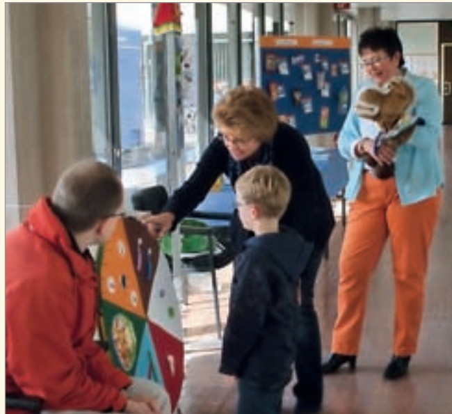
Die Kinder drehten an Jimmy's Glücksrad und freuten sich über Zahncreme und Zahnbürsten als Gewinne, aber auch über Bleistifte, „Ratzeummel“ und Spiegel mit Jimmy-Emblem.