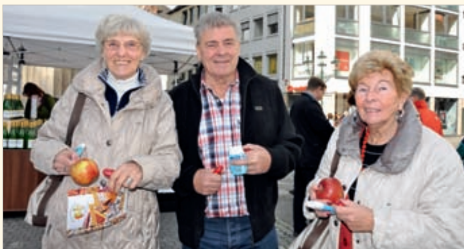
Auch die eigentliche Zielgruppe des diesjährigen Tags der Zahngesundheit, die Generation „65 plus“, war unter den Standbesuchern zahlreich vertreten. Die Seniorinnen und Senioren nutzten gerne die Gelegenheit, sich von den anwesenden Experten insbesondere zum Thema Implantate beraten zu lassen.