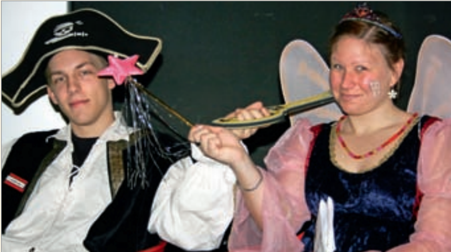
Während der gesamten Veranstaltung wurden die Kinder vom Piraten Karius und der Zahnfee begleitet.