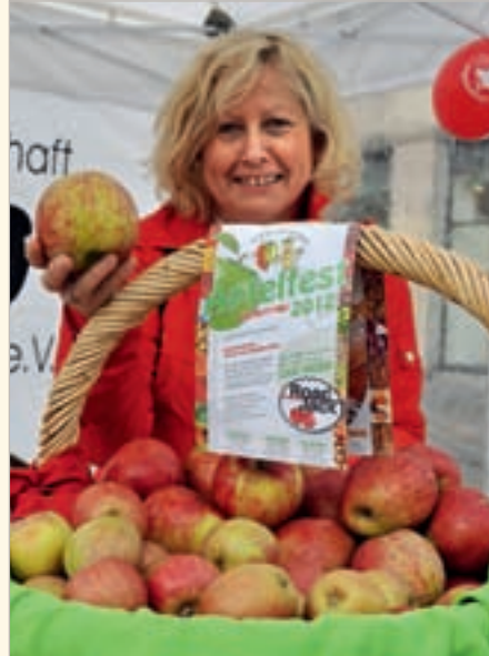
Viele Standbesucher wurden von den rotbackigen und erntefrischen Äpfeln angelockt, die das Meerbuscher „Apfelparadies“ gesponsert hatte.