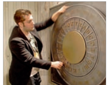
Caesar-Verschlüsselung leitet sich vom römischen Feldherrn Gaius Julius Caesar ab, der diese Art der geheimen Kommunikation für seine militärische Korrespondenz verwendet hat. Dabei benutzte er eine Verschiebung des Alphabets um drei Buchstaben.