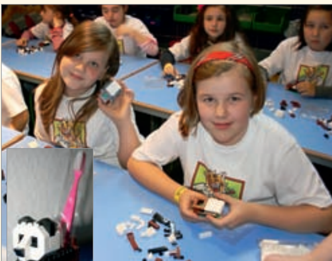
Schülerinnen der Duisburger Habichtschule beim Zusammenbau eines Zahnbürstenhalters in Pandabärenform aus Legosteinen.