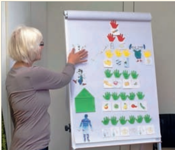
Schnell war die ganze Ernährungspyramide aufgebaut und alle konnten sehen, wovon man mehr oder eher weniger essen sollte.