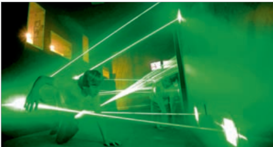
Hindernislauf durch einen Gang mit Laserbewegungsmeldern: Wer schlängelt sich durch die Lichtstrahlen bis zum Ziel hindurch, ohne Alarm auszulösen?